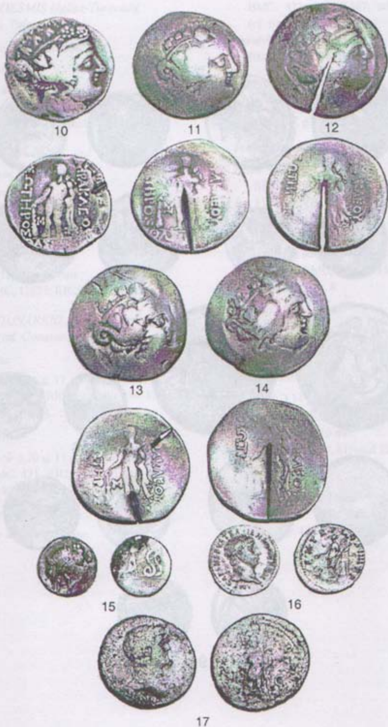
Pl. II. Monede grecești și romane: 10-14 tetradrahme thasiene (Craiova-împrejurimi); 15 denar roman republican (Iglița-Turcoaia); 16-17 emisiuni romane imperiale (Ciucurova).