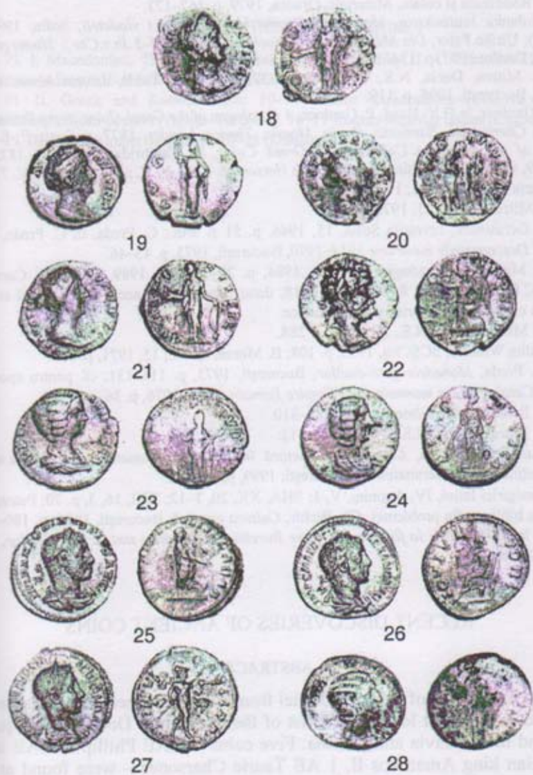
Pl. III. Denari romani imperiali, 18–28 (Dunăreni).