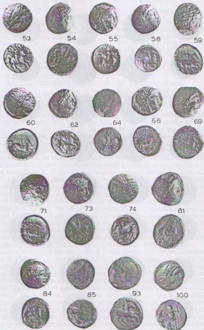
Pl. II. Monede macedonene din timpul lui Filip al II-lea și Alexandru al III-lea descoperite în Dobrogea.