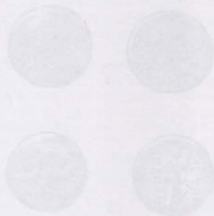
Fig. 1. Monede macedonice din Dobruja descoperite în anul 1959 (1) și în anul 1962 (2).

Pl. III: Macedonian coins of Alexander the 3 rd and Lysimach type, of Philippi and of "Macedonian shield" type discovered in Dobruja.