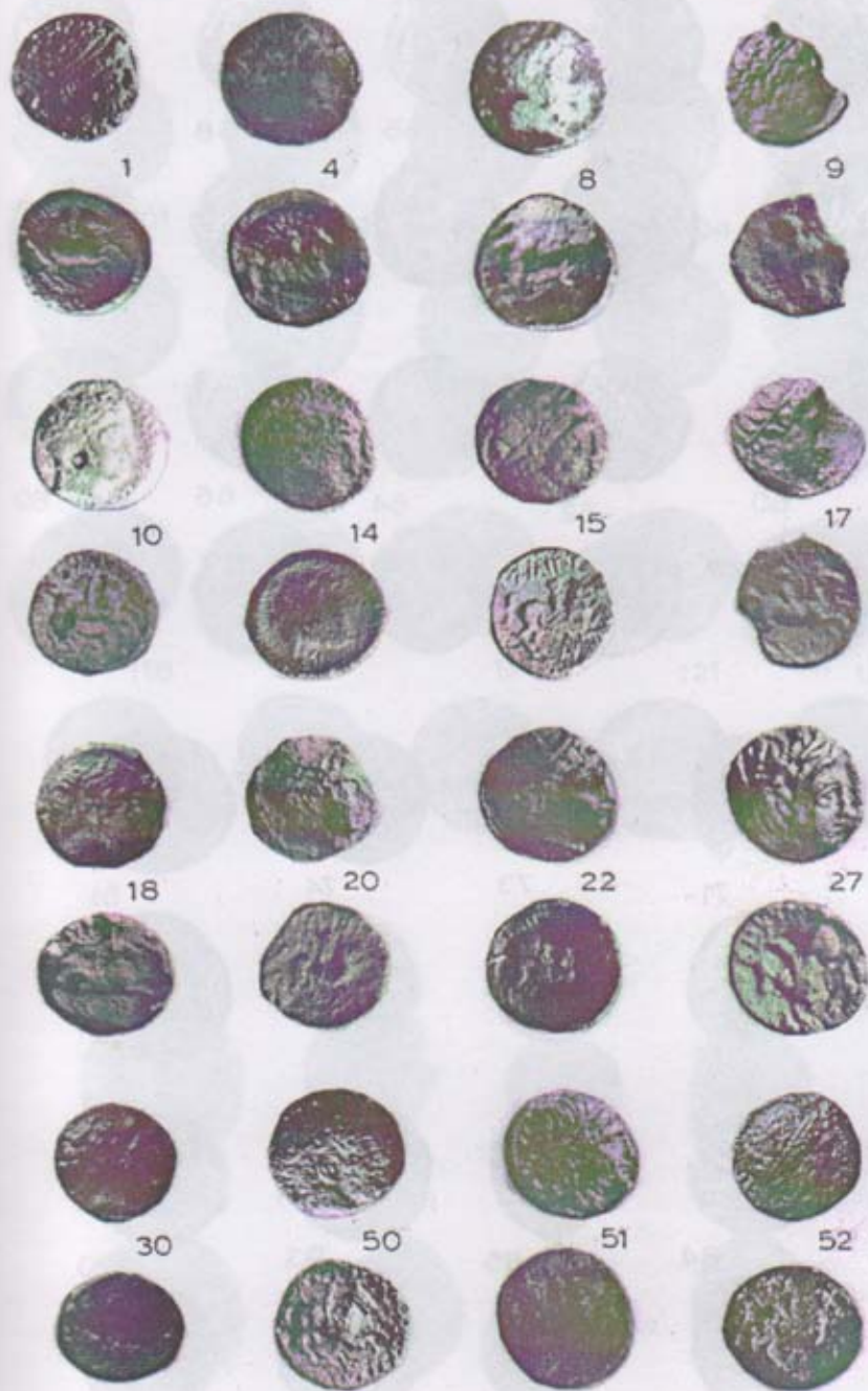
Pl. I. Monede macedonene din timpul lui Filip al II-lea descoperite in Dobrogea.