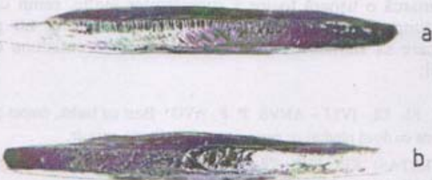
Fig. 3 a-b. Vedere a muchiei piesei de la Nădlac.

În concluzie, obiectul discutat acum constituie un fals monetar 4 . Caracterul îngrijit și foarte fidel al copierii indică indubitabil un produs antic. Deoarece originalul a fost bătut abia la 363 p.Chr. 5 , realizarea exemplarului prezentat acum trebuie să fi avut loc puțin timp după aceea 6 .