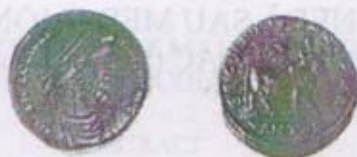
Fig. 1. Imitația monetară de la Nădlac: 1 x 1.