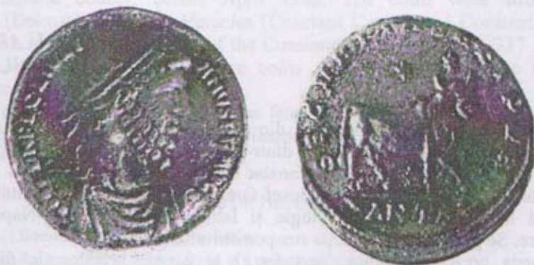
Fig. 2. Imitația monetară de la Nădlac: 2 x 1.