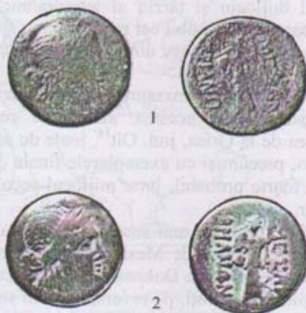
Fig. 1. Monede autonome din Mesambria descoperite la Alba Iulia (1) și Berghin (2).

Head, p. 279; I. Karayotov, Monetosečeneto na Mesambria 4 , Burgas, 1992, p. 45.