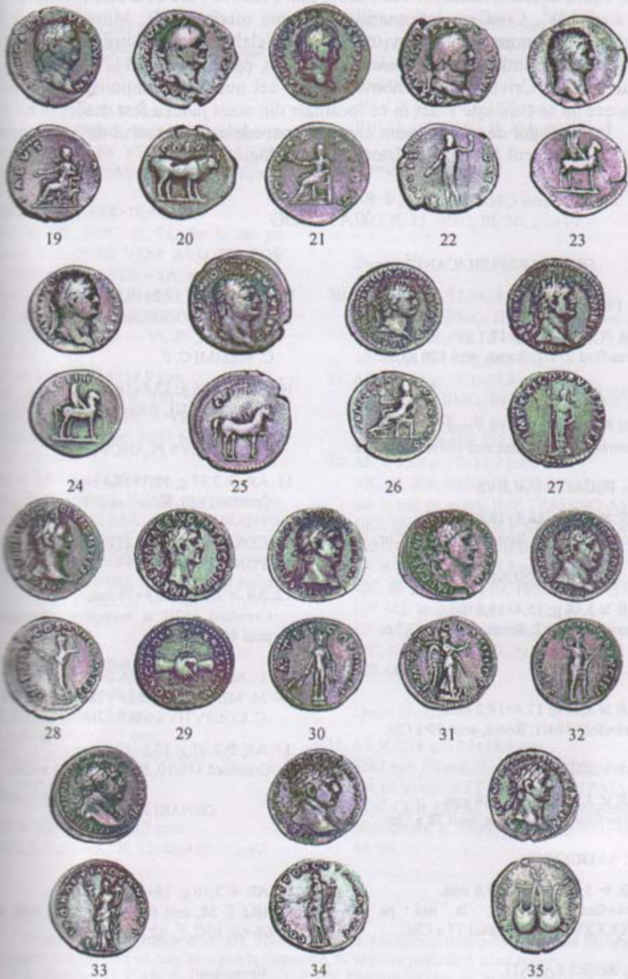
Pl. II. Monede din tezaurul de la Cocoșești.